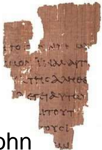
Back - John 18:37-38