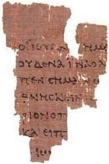
Front - John 18:31-33